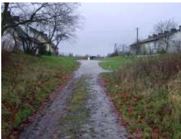
Infrastruktura komunikacyjna w miejscowości Załęcze – aktualny stan techniczny

Realizacja inwestycji przewiduje gruntowną poprawę stanu technicznego drogi gminnej oraz montaż oświetlenia, biegnącej centrum miejscowości Załęcze.