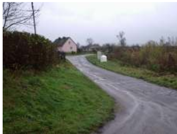
Infrastruktura komunikacyjna w miejscowości Załęcze – aktualny stan techniczny