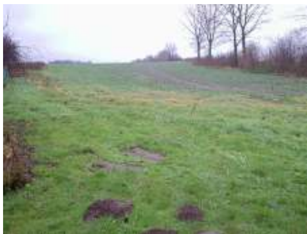
Teren pod budowę kompleksu sportowego w miejscowości Załęcze

Realizacja inwestycji przewiduje budowę infrastruktury sportowej w miejscowości Załęcze. Obecny poziom zagospodarowania tego terenu nie zaspokaja potrzeb związanych z rozwojem fizycznym mieszkańców.