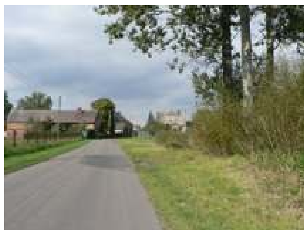
Droga Krzyżówka Wiry-Chlebowo – Chlebówko 54 – istniejąca infrastruktura drogową

Istniejący układ komunikacyjny nie zapewnia bezpieczeństwa publicznego. Realizacja inwestycji przewiduje budowę chodnika z kostki betonowej typu „polbruk” na odcinku 900mb, w miejscowości Chlebówko, prowadzącego do kościoła i cmentarza.