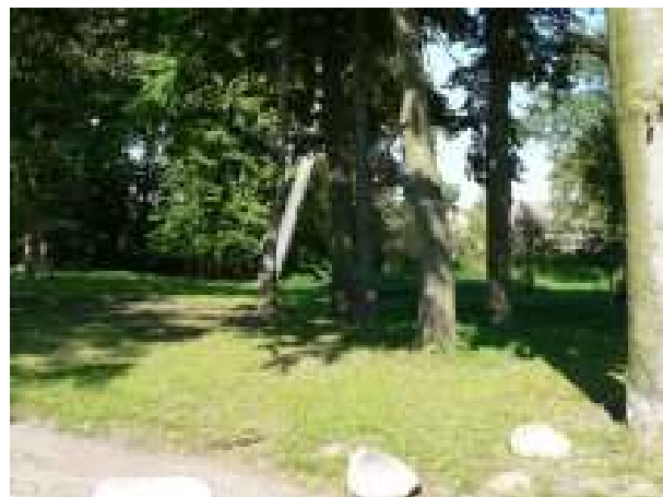
Teren parku - stan istniejący

Realizacja zadania przewiduje zagospodarowanie terenu parku w miejscowości Chlebówko.