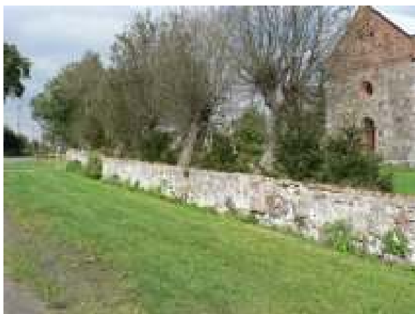
Mur przy kościele pw. Matki Boskiej Anielskiej w Chlebówko – aktualny stan techniczny

Projekt zakłada renowację muru przy zabytkowym kościele pw. Matki Boskiej Anielskiej w Chlebówku. Obiekt kościoła jest wpisany do rejestru zabytków.