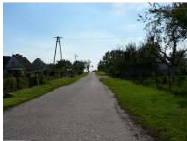
Infrastruktura drogowa w miejscowości Chlebówko, Chlebówko 23 - 27 – stan istniejący

Istniejący układ komunikacyjny nie zapewnia bezpieczeństwa publicznego. Realizacja inwestycji przewiduje budowę chodnika z kostki betonowej typu „polbruk” na odcinku 150 mb.