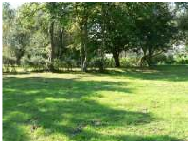
Teren pod budowę placu zabaw w miejscowości Chlebówko – stan istniejący

Realizacja zadania przewiduje budowę i wyposażenie placu zabaw w miejscowości Chlebówko. Zagospodarowanie terenu zabaw urządzeniami (huśtawki, bujaki, przepłotnie, „zamek”) dostosowanymi do wieku i możliwości rozwojowych dziecka w naturalny sposób stwarza dobre warunki dorosłym do sprawowania opieki nad bawiącym się dzieckiem. Konsekwencją wdrożenia projektu będzie poprawa bezpieczeństwa dzieci podczas gier i zabaw.