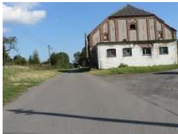
Infrastruktura drogowa w miejscowości Chlebówko, Chlebówko 7a – Szkoła Podstawowa – stan istniejący