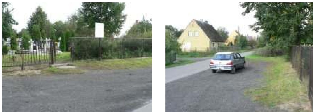
Teren parkingu przy cmentarzu w miejscowości Chlebówko – istniejąca infrastruktura