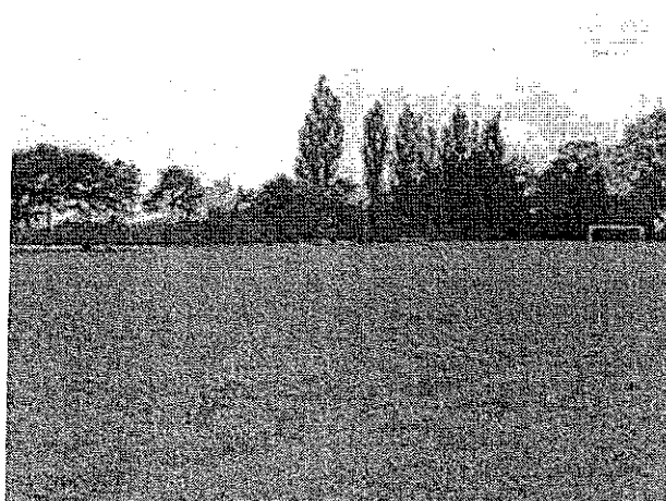
Teren pod budowę boiska gminnego – aktualny stan techniczny.

Projekt zakłada rozbudowę gminnego boiska wraz z „małą” infrastrukturą.