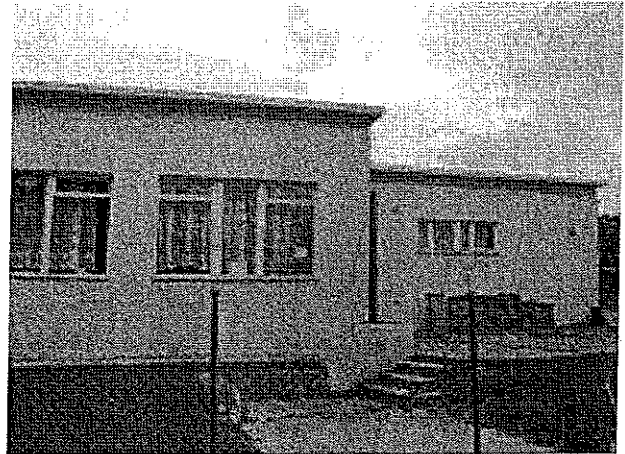
Stan istniejący świetlicy wiejskiej – widok z zewnątrz, aktualny stan techniczny.