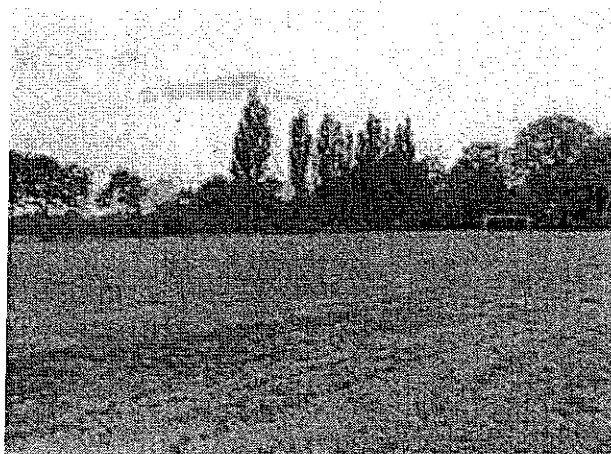
Teren pod budowę parkingu przy boisku – aktualny stan techniczny.

Projekt zakłada się budowę parkingu przy boisku w miejscowości Chlebowo.