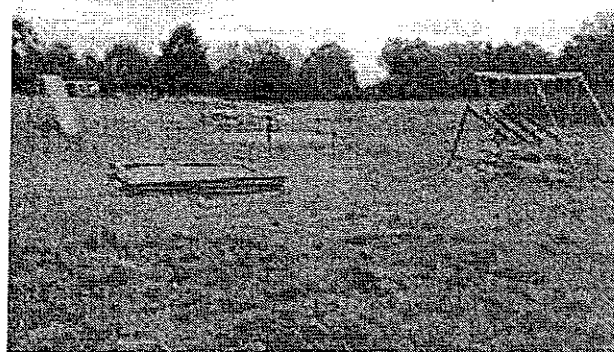
Teren placu zabaw przy boisku – aktualny stan techniczny.

Inwestycja zakłada przebudowę istniejącego placu zabaw. Realizacja projektu przewiduje wymianę zdewaluowanych urządzeń na nowe (huśtawki, bujaki, przepłotnie, „zamek”), które będą dostosowane do wieku dzieci i będą bezpieczne w użyciu.