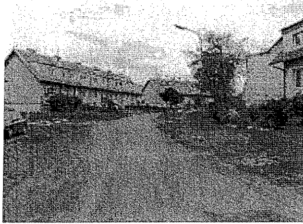
Miejsce lokalizacji chodnika – aktualny stan techniczny.

Realizacja inwestycji przewiduje budowę chodnika z kostki betonowej typu „polbruk” na odcinku 400 mb. Istniejący stan techniczny pobocza drogi nie zapewnia wystarczającego bezpieczeństwa mieszkańcom Chlebowa. Konsekwencją wdrożenia projektu będzie poprawa ruchu kołowego i funkcjonalności ruchu pieszego, a także poprawa estetyki przestrzeni, jak również zwiększenie bezpieczeństwa mieszkańców Chlebowa.