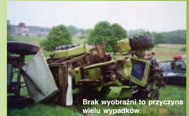
Brak wyobraźni to przyczyna wielu wypadków

Co roku przy pracach transportowych ginie około 100 rolników. Wypadki w transporcie rolniczym to 7 procent ogólnej liczby wypadków.