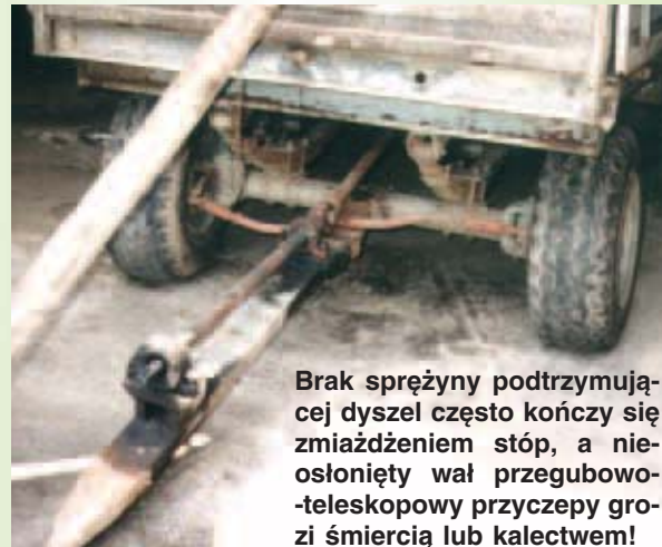
Brak sprężyny podtrzymującej dyszel często kończy się zmiążdżeniem stóp, a niesłonięty wał przegubowo-teleskopowy przyczepy grozi śmiercią lub kalectwem!

balotów (kostek) prasowanego siana i słomy, dyszli i zaczepów, maszyn i przyczep podczas sprzęgania ich z ciągnikiem, burt przyczep podczas prac przeładunkowych, skrzyni przyczep samowyladowczych oraz przyrządów żniwnych (hederów) kombajnów zbożowych podczas ich naprawy, materiałów budowlanych przy pracach remontowo-budowlanych.