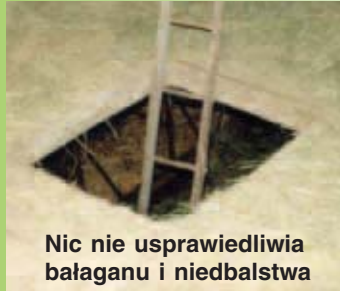
Nic nie usprawiedliwia bałaganu i niedbalstwa

Co drugie nieszczęśliwe zdarzenie w gospodarstwach rolnych spowodowane jest przez upadek. Sprzyjają temu śliskie, nierówne, źle utwardzone podwórza. Groźne są niezabezpieczone kanały, wykoppy, szamba, otwory ścienne i stropowe na strychach i poddaszach, niewłaściwie prowadzone prace na wysokości.